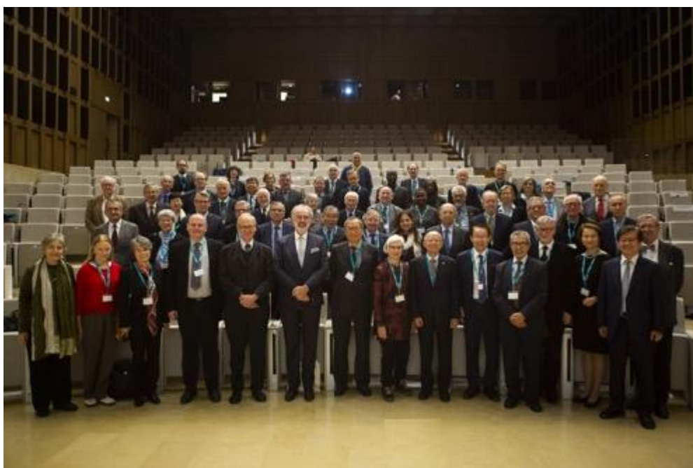
Delegates at the General Assembly of the UAI, 2019